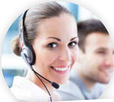
... im Kundenservice

„Bei meiner Arbeit steht der Servicegedanke an erster Stelle. Mit cobra kann ich Kunden und Interessenten schnell und flexibel weiterhelfen, weil alle Informationen, auch aus anderen Abteilungen, immer aktuell verfügbar sind. Hier arbeitet jeder Hand in Hand. Das merken unsere Kunden und sind begeistert.“