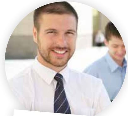
... im Vertrieb

Mein persönliches Highlight: Ich kann Kunden und Interessenten nach bestimmten Kriterien ganz spontan selbst selektieren. Damit ist die Akquise viel effizienter.“