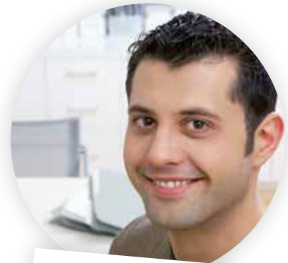
... im Backoffice

Einfach spitze: Das schnelle Erfassen von Adressen per Drag&Drop.“