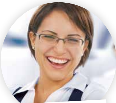
... im Marketing

„Mit cobra gehen mir Marketingaktionen ganz einfach von der Hand. Ich selektiere die genaue Zielgruppe im Handumdrehen und nutze dann die cobra Funktionen für personalisierte E-Mails, tolle HTML-Newsletter und portooptimierte Serienbriefe.“